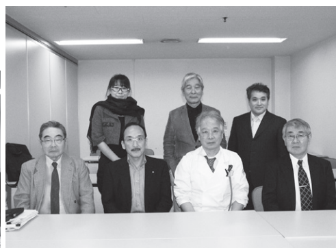
編集委員会にて(4月20日)